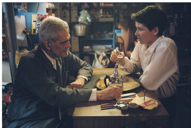
عومەر شەریف لە رۆلی مسیۆبرایم لە گەل مەمۆ (وینەیی فیلم)

له راده به دەر پێی خۆش بوو که بانگهێشتنه که یم قبول کرد. له خۆشیان کولمه کانی سوور هه لگه ران. هیندهی پێخۆش بوو ده تگوت سهت ده رگای گاله دراوم به سه ردا کردۆته وه.